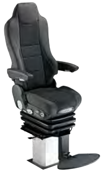
Nautic Pro Star Air