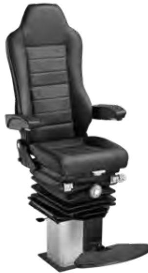
Nautic Pro Star