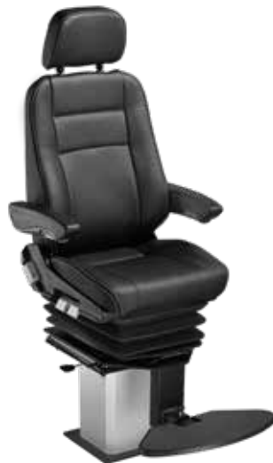
Nautic / Nautic Eco