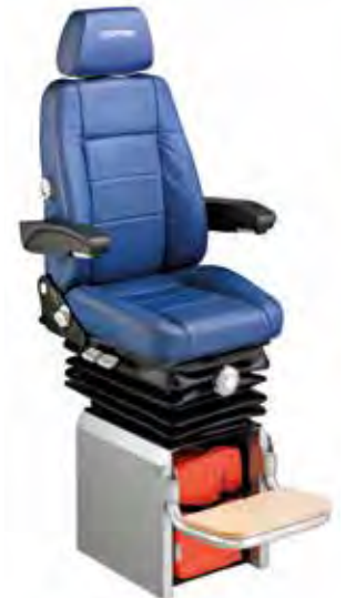
Nautic Star Crew