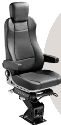
Operator Star Slim