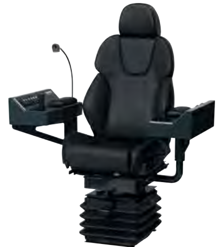
Interfaces sur mesure